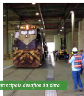
Longos períodos de chuvas: um dos principais desafios da obra