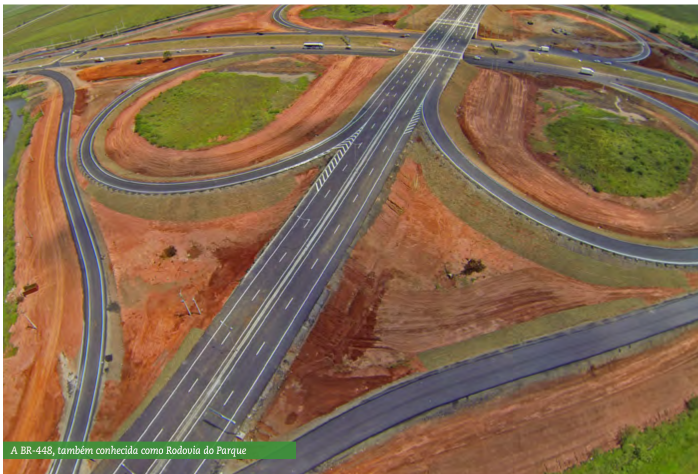
A BR-448, também conhecida como Rodovia do Parque

Foram executadas as OAE de estrutura pré-moldada, sendo um elevado de 2 km de extensão, uma ponte de 232 metros, um viaduto de 208 metros, um de 80 metros, um de 52 metros e outros sete de 28 metros, além de três passarelas para travessia de pedestres. Assim como na BR-448, este projeto exigiu técnicas construtivas específicas para a implantação de estrada em 500 metros de solo mole. ◆