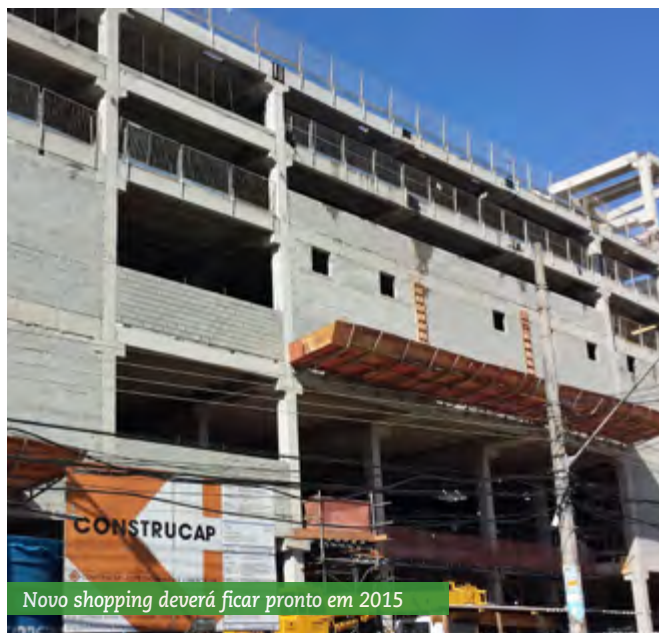
Novo shopping deverá ficar pronto em 2015

Uma das peculiaridades do projeto foi a necessidade de fazer um trabalho de adaptação do local, por conta de seu terreno acidentado. Durante sete meses, ainda na primeira fase, foram executados, simultaneamente, a terraplanagem, drenagem, pavimentação (com execução de duas ruas no entorno do shopping e a remoção de uma rua desnivelada) e a contenção em solo grampeado (com a correção de um desnível de 17 metros). Atualmente, a obra está em fase de finalização de uma superestrutura em pré-moldado, com concreto moldado alvenaria e execução da estrutura metálica e instalações. O projeto, contratado pela BRMalls, totalizará 22 meses de obras. Atraindo clientes também de outras cidades da região, das quais se destacam Belford Roxo, Mesquita e Nilópolis, o TopShopping recebe atualmente 10 milhões de visitantes ao ano. ◆