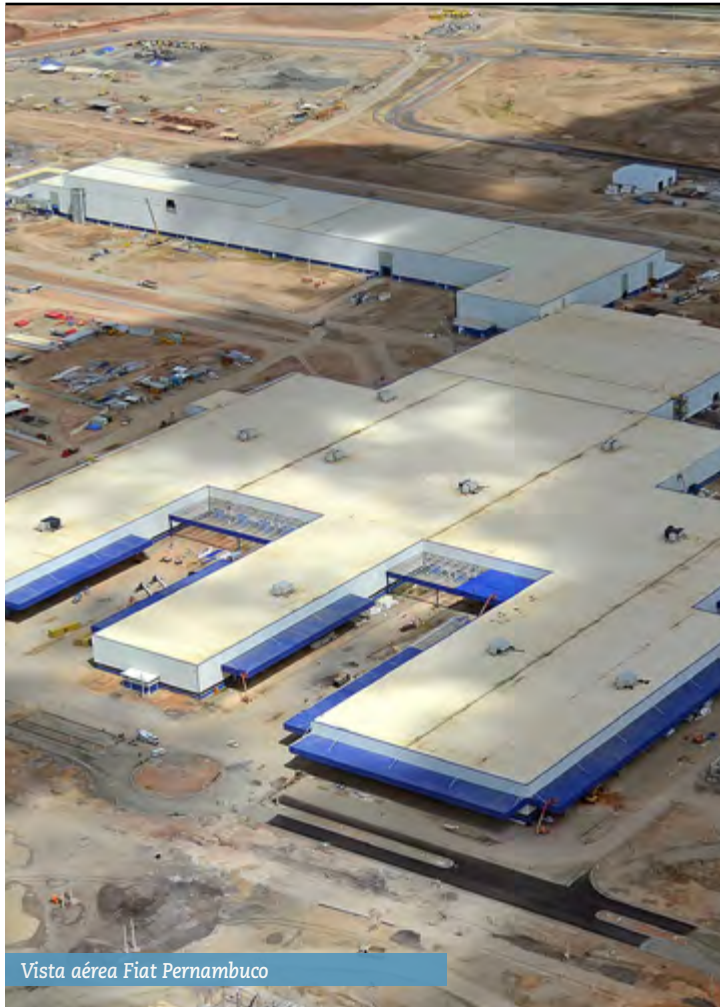
Vista aérea Fiat Pernambuco