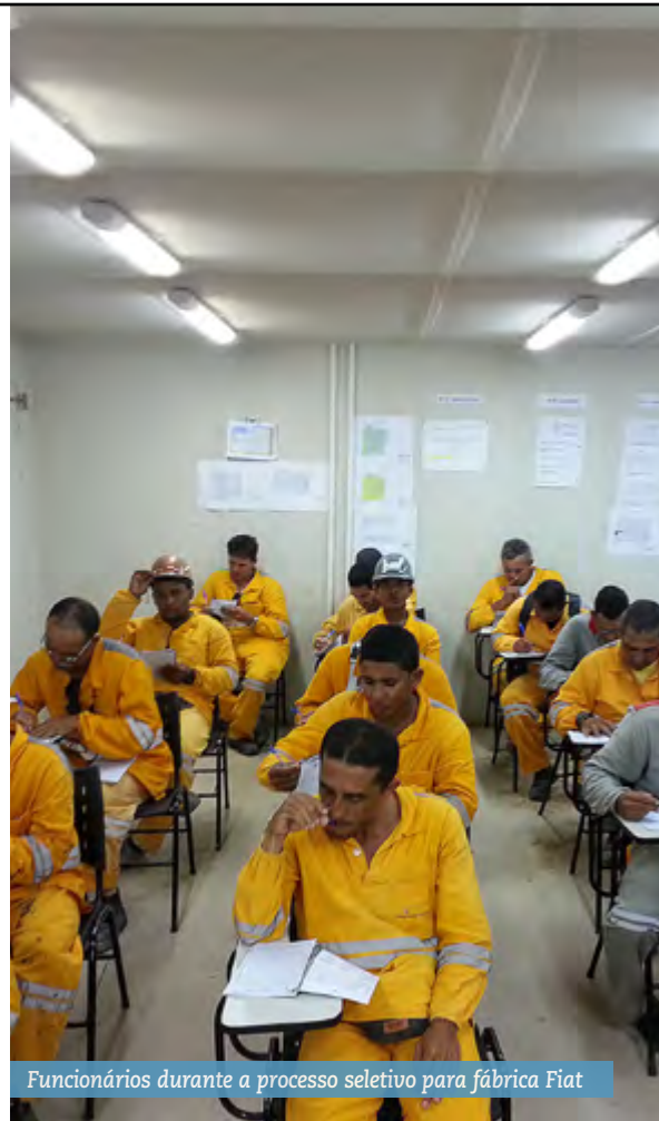
Funcionários durante a processo seletivo para fábrica Fiat