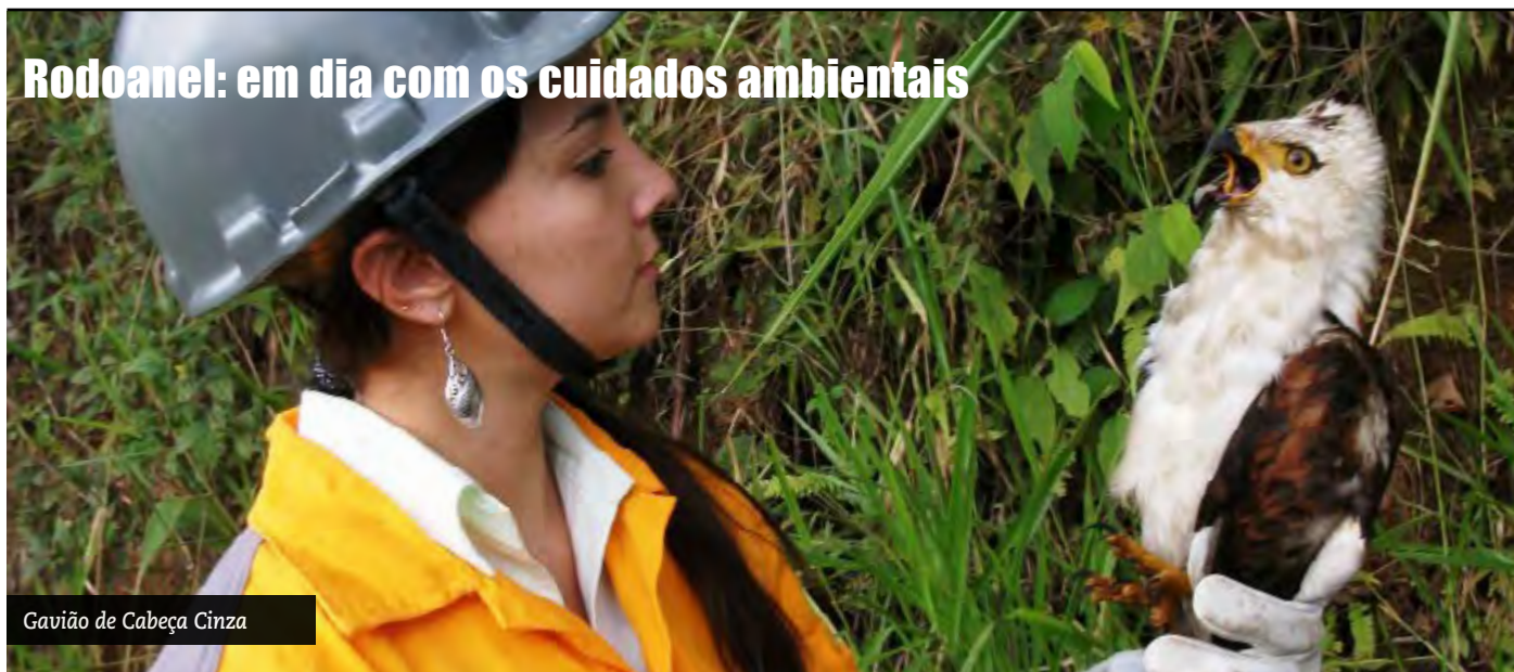
Gavião de Cabeça Cinza

Em todos os seus projetos, a Construcap segue os parâmetros adotados pelo Sistema Integrado de Gestão (SIG), que envolve o meio ambiente, qualidade, segurança e saúde. As ações voltadas ao primeiro desses aspectos – a questão ambiental – podem ser exemplificadas pela obra em andamento no Lote 5, trecho Norte do Rodoanel Mário Covas, em São Paulo.