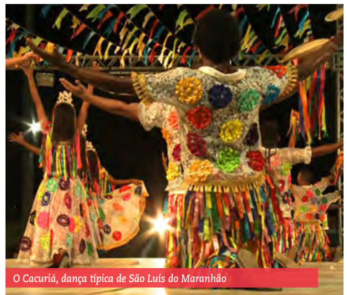
O Cacuriá, dança típica de São Luís do Maranhão

O município de São Luís é banhado pelas águas da baía de São Marcos e do Oceano Atlântico e conta com 32 quilômetros de praias na região metropolitana, caracterizada por suas águas turvas devido a proximidade dos rios. São Luís também usufrui de uma extensa área de manguezal e quatro áreas de preservação ambiental: o Parque Estadual do Bacanga, com mais de três mil hectares de extensão, o Parque Estadual do Itapiracó, com 322 hectares e a Área de Proteção Ambiental do Maracanã. ◆